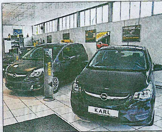
Im Autohaus Klaus Lammel finden sich neben Opel Neuwagen auch Top-Gebrauchtfahrzeuge.